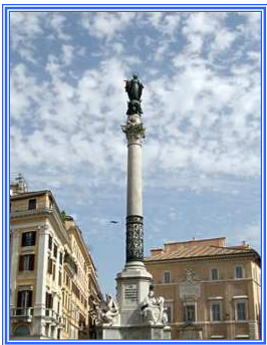
Statua dell'Immacolata a Piazza di Spagna- Roma

Duplici festa: Immacolata e anniversario fondazione Congregazione Missionari del Sacro Cuore di Gesù